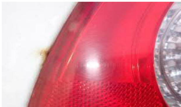
levý zadní blatník korodován ve styku se zadní svítlou