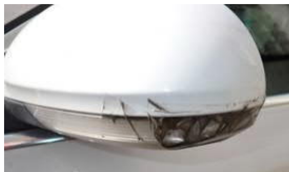
levé zrcátko poškozeno