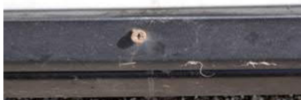
spodní lišta levých předních dveří provizorně uchycena