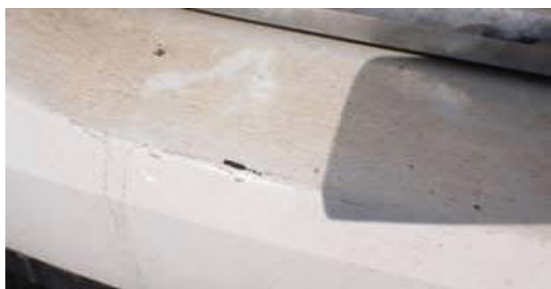
zadní nárazník poškozen