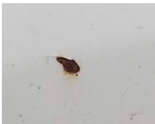
levý zadní blatník korodován