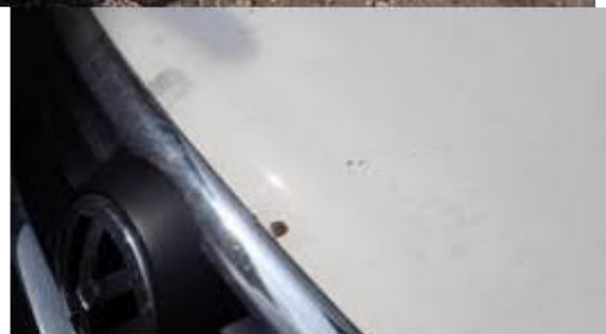
víko motoru poškozeno+ poškození neopravována-korodována