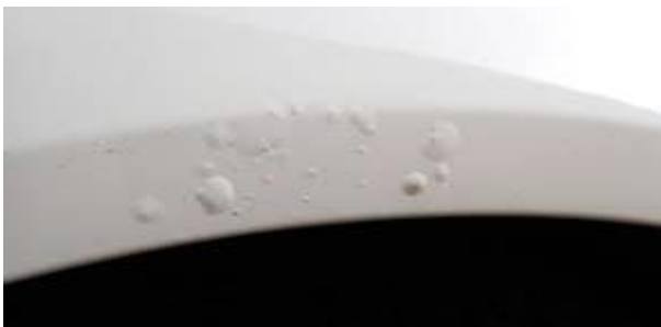
oba přední blatníky zkorodovány