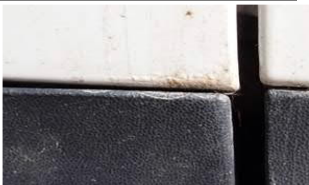
levé přední dveře zkorodovány