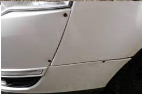
přední nárazník po havarii provizorně uchycen