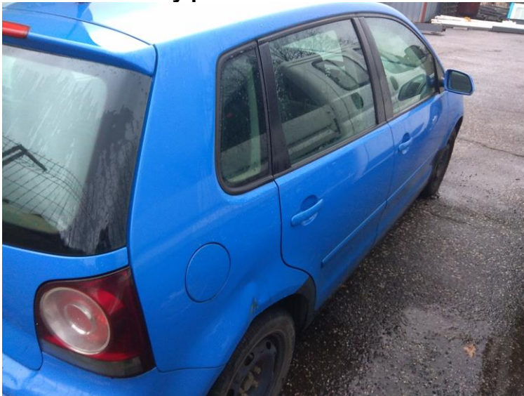
foto č.3 - deformace PZ blatník